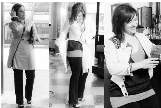
شکل ۱۷- طرح لباس قابل تبدیل YAY

شرکت طراحی «YAY» در نظر دارد که زنان را در جهت رسیدن به سبک فردی خود همراهی کند و کاری کند که زنان تنوع لازم در لباس خود را داشته باشند. این شرکت با طراحی و ساخت پارچه‌هایی با متریال عالی سعی در تولید لباس‌هایی منحصر به فرد دارد که سرشار از حس راحتی و زیبایی باشد. در نتیجه بهترین متریال را از سراسر جهان جهت تولید به آمریکا وارد می‌کند. هدف این برند، طراحی لباس‌هایی است که با آن‌ها بتوان تنوع زیادی ایجاد کرد در صورتی که فضای گنجه اتاق شما را پر نکنند. همچنین لباس‌های تغییرپذیر شرکت YAY اجازه می‌دهد که شما در وقت خود نیز صرفه‌جویی کنید. اگر شما قصد این را دارید که از محل کار خود مستقیم برای صرف شام به بیرون بروید، با لباس‌های طراحی شده در YAY می‌توانید با تغییرات کوچکی در لباس خود آن را به لباسی مناسب تبدیل کنید. بدون اینکه نیاز به رفتن به خانه و تعویض لباس داشته باشید. (شکل ۱۷) شرکت طراحی مد YAY به شما این امکان را می‌دهد که برای تعطیلات خود