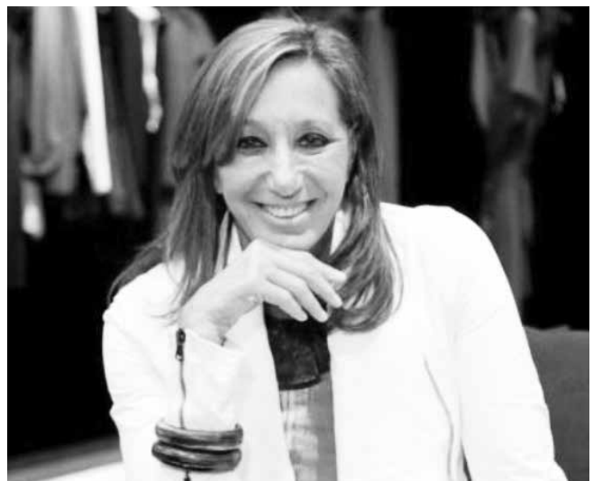
شکل ۵- دنا کاران

دنا کاران، سر طراح شرکت بین‌المللی که نامش را در بر دارد می‌گوید: "هر کاری که انجام می‌دهم درباره قلب، بدن و روح است. طراحی برای من، بیان خودم به عنوان یک زن با همه پیچیدگی، احساسات و عواطف می‌باشد." (شکل ۵) در واقع کاران غرایز زنانه خود را به موفقیت شرکتی نسبت داد که در سال ۱۹۸۴ با آخرین همسرش «استفان ویس» بر پا کرد، که قرار بود به یک موسسه تجارت عمومی در سال ۱۹۹۶ تبدیل شود و سپس ۵ سال بعد توسط صاحب فعلی‌اش، توده تجملاتی فرانسه Louis Vuitton، Moët Hennessy، LVMH، کشف شد. کاران می‌گوید: «این که من یک زن هستم باعث می‌شود که دیگران را