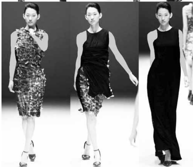
شکل ۱۴- طراحی لباس تغییرپذیر در سال ۲۰۱۳ توسط چالایان