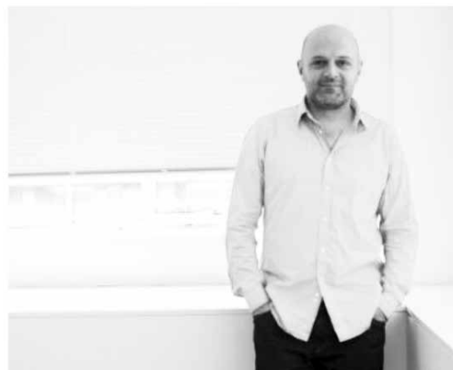
شکل ۱۲- حسین چالایان

در سال ۱۹۹۹ و ۲۰۰۰، تاج مسابقات بهترین طراح سال انگلستان را دریافت کرد. در سال ۲۰۰۰ کلکسیونی طراحی کرد که در آن یک ست کامل مبلمان به لباس‌هایی با قابلیت پوشیدن تبدیل می‌شدند. (نگارنده) (شکل ۱۳) چالایان همیشه برای بودجه و اعتبار تلاش می‌کرد، اغلب پیشنهادهای مختلفی از کمپانی‌های دیگر و کشور خودش دریافت می‌کرد. زمانی که شرکت TSE تصمیم گرفت که با وی قرارداد جدید نیندند باعث شد که چالایان مبلغی حدود ۲۵۰ هزار پوند بدهکار و مجبور شود با شرکت به صورت توافقی تسویه کند. بعد از آن، او شرکت خودش را بازسازی کرد و در سال ۲۰۰۱ به صحنه مد برگشت البته بدون نمایش لباس، همچنین به طراحی برای شرکت «مارکز و اسپنسر» پرداخت. او در سال ۲۰۰۲ خط تولید لباس مردانه را به راه انداخت و در سال ۲۰۰۳ طرحی را به تصویر کشید و اجرا کرد که از طریق نامرتب قرار دادن پارچه‌ها بر روی هم درست شده بود. همکاری او با طراحان و شرکت‌های هنری پایان پیدا نکرده بود و او همچنان با شرکت‌های طراحی مختلف کار می‌کرد. در سال ۲۰۰۸ یک سری لباس با لیزر LED با همکاری مارک تجملی «اسواروسکی» طراحی کرد و در توکیو به نمایش گذاشت. ۲۸ فوریه ۲۰۰۸ او به عنوان طراح خلاق مارک آلمانی با تولیدات ورزشی «پوما» استخدام شد. او