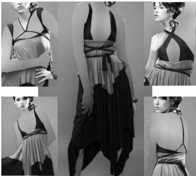
شکل ۱۱- طرح دومینیک انصاری

حسین چالایان متولد ۱۲ آگوست ۱۹۷۰ در نیکوسیا قبرس است. (شکل ۱۳) در سال ۱۹۷۸ او به همراه خانواده‌اش به انگلستان نقل مکان کردند. او اول در رشته