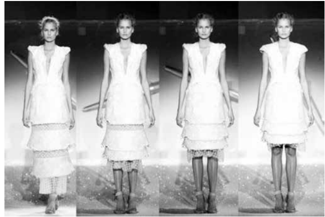
شکل ۱۵- طراحی لباس تغییرپذیر در سال ۲۰۰۷ توسط چالایان

در سال ۲۰۰۹ یک شوی لباس دیگر گذاشت. یکی از لباس‌های این شو را در موزه طراحی لندن نگهداری می‌کنند. (www.en.wikipedia.org) در سال ۲۰۱۳ نیز او کلکسیونی از لباس ارائه داد که در آن تعدادی لباس تغییرپذیر وجود داشت. قدرت طراحی و خلاقیت چالایان در لباس‌های تغییرپذیرش به اندازه‌ای است که تشخیص طرح اولیه لباس و طرحی که بعد از تغییر پیدا می‌کند واقعاً دشوار است. همچنین این لباس‌ها به راحتی و با یک حرکت ساده تبدیل می‌شود که این خود نشانگر قدرت تفکر و خلاقیت طراح است. چالایان در طراحی این لباس‌ها سعی کرده با پارچه سازی و استفاده از تضاد رنگی در انتخاب پارچه‌های مورد نظرش تفاوت لباس را در هر دو شکل بالا ببرد. (شکل ۱۴)