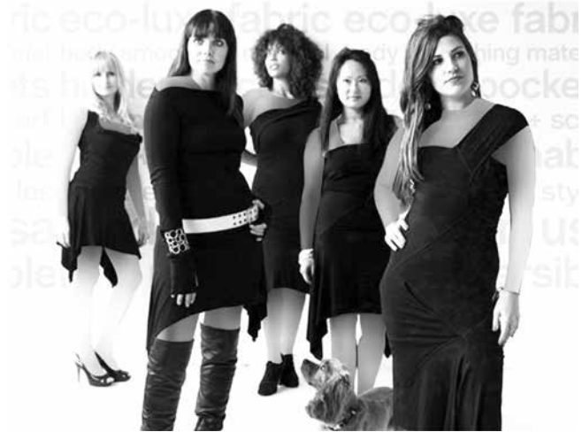
شکل ۴- لباس طراحی شده توسط کت بیگار

همراهان کاران در دوره شغلی طولانی او موفقیت‌هایش را که با سختی‌های