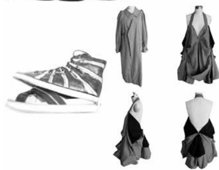
شکل ۱- نمونه‌های از لباس‌های تغییرپذیر

او هم زمان با کار به عنوان روزنامه‌نگار، طراحی لباس‌های تغییرپذیر را نیز انجام می‌داد. در سال ۱۹۷۲ لیدیا به لندن نقل مکان کرد و در کالج مد لندن مشغول به تحصیل شد. در ۵ می ۱۹۷۶ لباس تغییرپذیر خود را طراحی کرد و در دسامبر ۱۹۷۷ طرح خود را به عنوان اولین لباس زنانه‌ای که قابلیت تغییر به مدل‌های