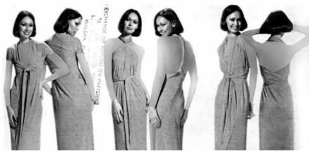
شکل ۳- اولین لباس تغییرپذیر که توسط لیدیا سیلوستری طراحی شد

مختلف را دارد ثبت کرد. (شکل ۳) در سال ۱۹۷۶ سیلوستری کمپانی خود را با نام لیدیا دیزاین ltd.Inc افتتاح کرد. بعد از آن لیدیا در تمام رسانه‌های تلویزیونی، رادیویی و رسانه‌های چاپی مصاحبه‌هایی برای ترویج و تبلیغ لباس تغییرپذیر خود انجام داد. از سال ۱۹۷۶ تا ۱۹۹۴ لباس تغییرپذیر فقط در آمریکا، انگلیس، تایلند، سنگاپور و پورتوریکو به فروش می‌رفت.