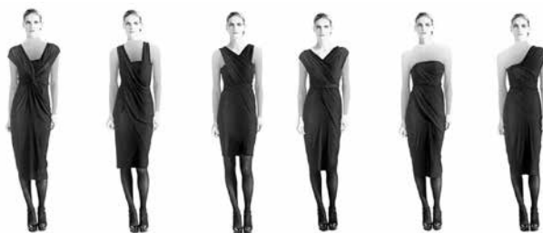
شکل ۶- نمونه‌ای از طراحی لباس تغییرپذیر دنا کاران

فراوان به دست آورده بود تایید و قدردانی کردند. انجمن طراحان مد آمریکا به ۶ مد روز او تبریک گفته‌اند و اخیراً در سال ۲۰۱۰ به عنوان بهترین طراح لباس زنانه سال معرفی شد. در سال ۲۰۰۳ کاران اولین طراح آمریکایی بود که جایزه سوپرستار بین‌المللی انجمن مد را دریافت کرد. یک سال بعد مدرسه کاران برای یادآوری مشارکتش با مدرسه و صنعت مد به او دکترای افتخاری داد و در سال ۲۰۰۷ مجله «گلامور» نام کاران را در فهرست زنان موفق سال آن مجله قرار داد.