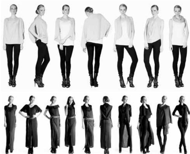
شکل ۱۸- لباس مسافرتی طرح شرکت YAY

نیاز به بردن لباس‌های زیادی نداشته باشید و نگران این نباشید که در تعطیلات مجبور به حمل تمام لباس‌هایتان باشید. شما در این لباس‌ها احساس راحتی خواهید داشت و به دلخواه خود و متناسب با شرایط و موقعیت خود لباس دلخواهتان را ایجاد می‌کنید. (شکل ۱۸) YAY تولیدات پوشاک خود را این‌گونه بیان می‌کند که ما لباس‌های تغییرپذیر را برای زنانی طراحی می‌کنیم که فعالیت زیادی دارند و عاشق مسافرتند و با لباس‌های کم حجم و قابل تبدیل خود به آن‌ها برای رسیدن به خواسته‌هایشان کمک می‌کنیم. (www.Yayde-signs.com)