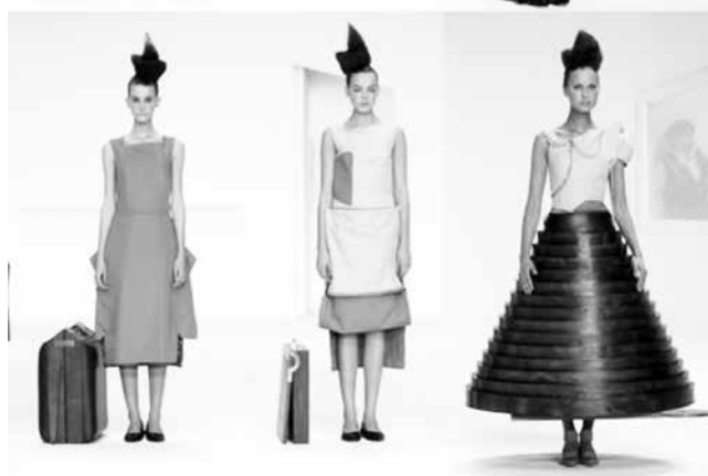
شکل ۱۳- طراحی لباس با استفاده از کاور میل