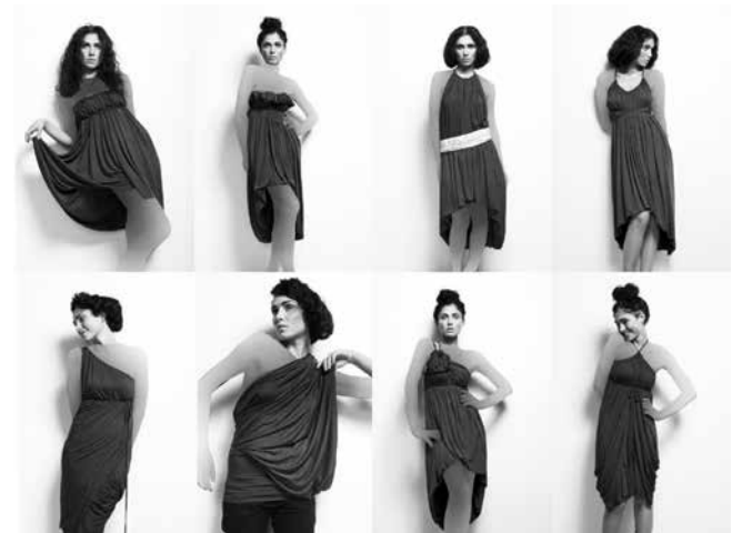
شکل ۱۶- طراحی لباس تغییرپذیر، برند امامی

برند «امامی» یک تیم طراحی جوان، جدید و تازه تأسیس اسکاندیناویایی است که به طراحی نوآورانه، منحصر به فرد و با کیفیت می‌پردازد. طراحی‌های آن‌ها آوانت گارد و مبنای کارشان روی لباس‌های چند منظوره یا تغییرپذیر است. برند